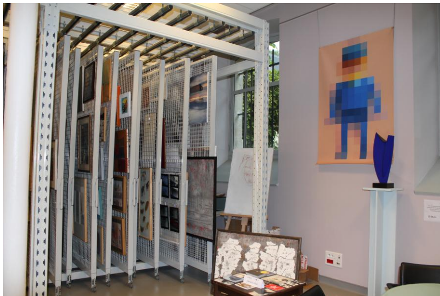
Salle de prêt de l'Artothèque

La visite de l'Artothèque s'adresse à tous les scolaires, de l'Ecole maternelle au Lycée. Adaptée à chaque niveau, cette visite est l'occasion de développer la curiosité de l'élève vis-à-vis du travail des artistes, tout en l'amenant à former son propre regard critique sur la création contemporaine.